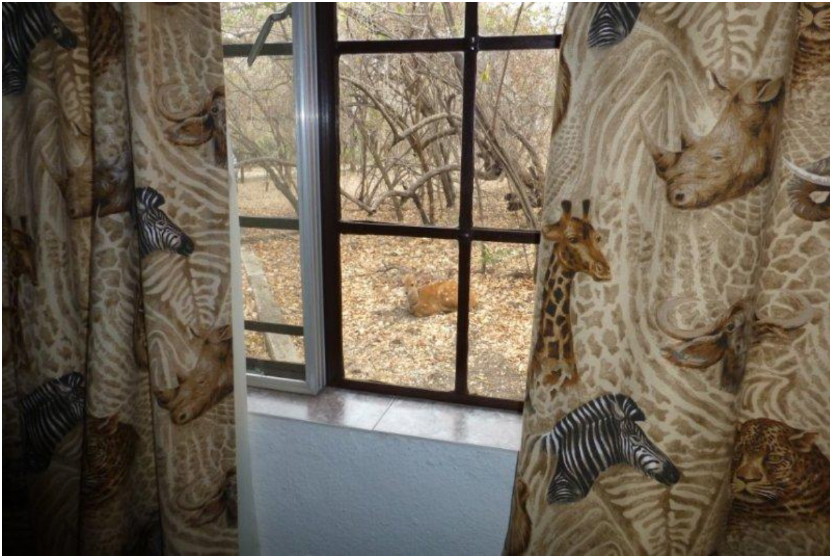
Bosbok slaapt om het huis bij Mhofu

Al gauw zagen we de leeuwen, zo mooi! Wat een begin!